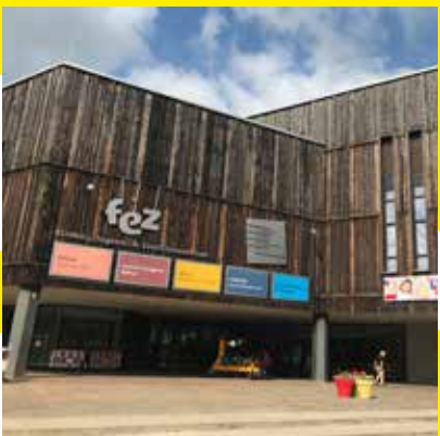
Haupteingang zum FEZ-Berlin im Volkspark Wuhlheide im Bezirk Treptow-Köpenick.